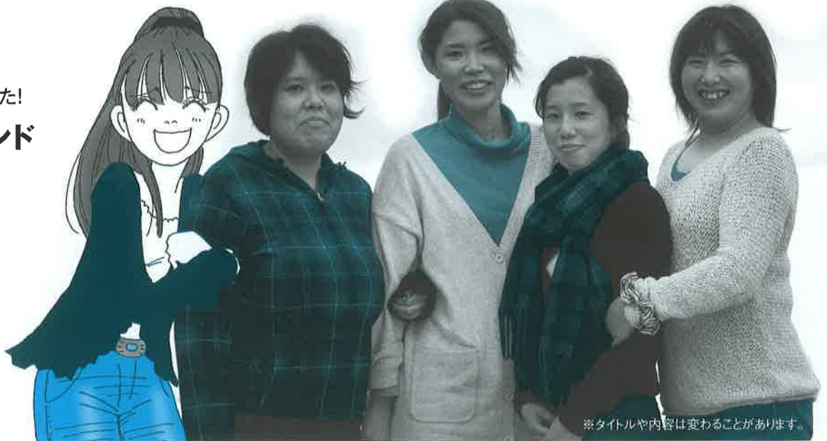
※タイトルや内容は変わることがあります。

■定価(税込) 4月号650円、5月号590円 2014年6月号からは普通月号606円 付録月号(4・11)668円 年間定価合計7,396円